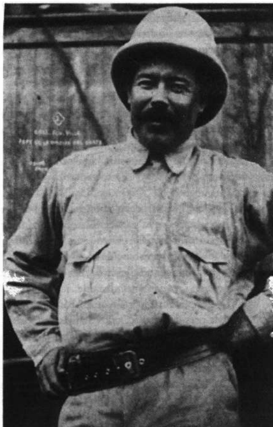
Figura 2. Nótese que es villa quien la da 'su carácter social' y su 'trascendencia' a la Revolución. Parafraseando a Vasconcelos: por su raza habló el espíritu (nacional).