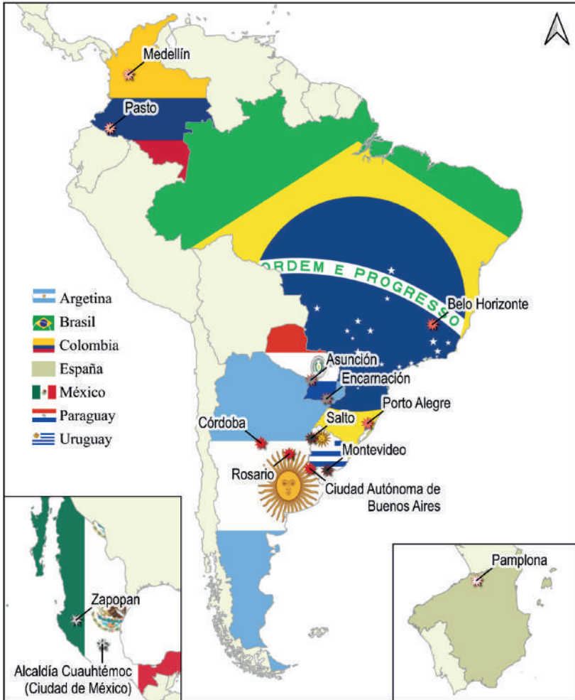
Ilustración 2. Casos locales analizados por país