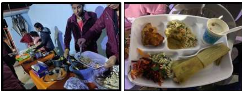
Imagen 5 Reparto de prasādam en el cumpleaños 96 de Sathya Sāi Bābā. Tamales de verdura al curry, arroz basmati, ensalada, keer, pakhora y samosa.

Lucero López, 2022, Sāi Guru Āśram Tijuana