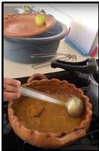
Imagen 2 Sambar en olla de barro mexicana. Cocina de la Sra. Mahendru.

de origen indio. Entre los cuales se cuenta el Sāi Guru Āsram 5 , y se pudieron observar de primera mano las adaptaciones en la dieta de la familia y de los alimentos que se ofrecen a los dioses.